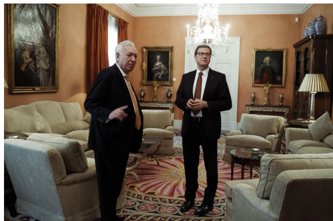
El Ministro de Asuntos Exteriores y de Cooperación, José Manuel García-Margallo, junto al Ministro de Exteriores alemán, Guido Westerwelle, en un encuentro celebrado en el Palacio de Viana de Madrid en diciembre de 2013.

17.03-18.03.07.- S.M la Reina.- Viaje privado.- Schloss Zwing 16.05-17.05.07.- SS.MM. Los Reyes.- Premio Carlo Magno.- Aquisgrán 15.06.07.- Excmo. Sr. Presidente del Gobierno, D. José Luis Rodríguez Zapatero.- Encuentro con la Canciller alemana Sra. Merkel.- Berlín 07.09-08.09.07.- Doña Teresa Fernández de la Vega, Vicepresidenta 1 o del Gobierno.- entenario de la Internacional Soc. de Mujeres.-Stuttgart