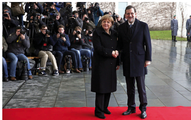
El presidente del Gobierno, Mariano Rajoy, junto a la canciller alemana, Ángela Merkel, durante la cumbre hispano-alemana celebrada en Berlín en febrero de 2013